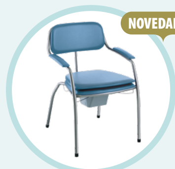
Invacare® Omega Clásica Verde 1471628